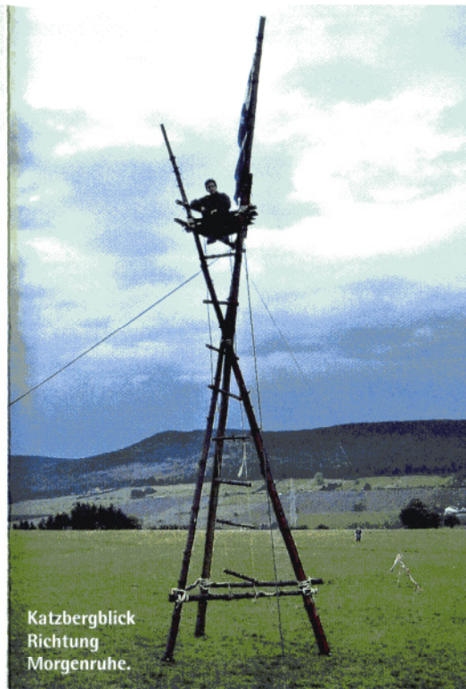
Katzbergblick Richtung Morgenruhe.